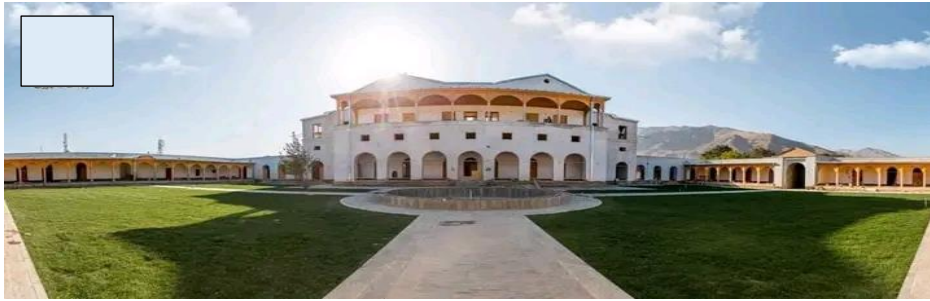
شکل شماره ۱: تصاویری از ارگ جبل السراج